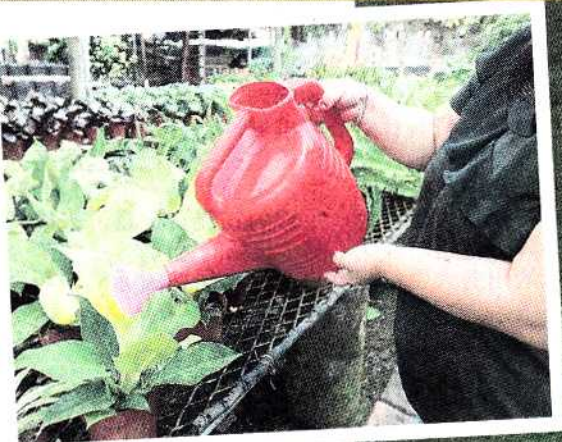
■民众受促用喷壶代替水管，给植物和花园浇水。