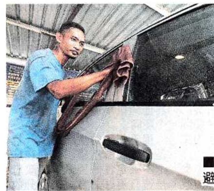
■檳供水机构促请民众，避免频密洗车和洗摩哆。